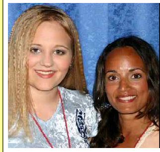
Auftritt 2004 mit EMILIA aus Schweden. (Big Big World..)